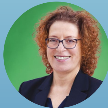
Petra Kuhlendahl BÜNDNIS 90/ DIE GRÜNEN