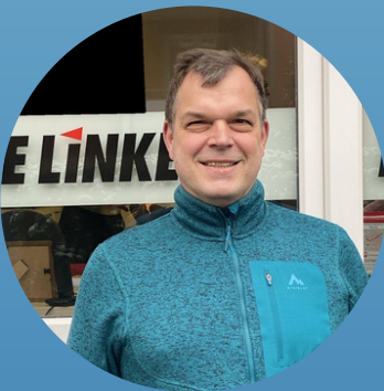
Rolf Breuer DIE LINKE