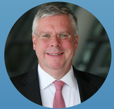
Jürgen Hardt CDU